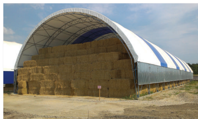
На готовій основі у клієнта