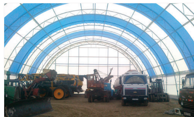
Основа – на закладних елементах