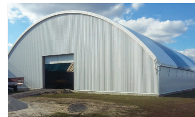
Основа – на закладних елементах