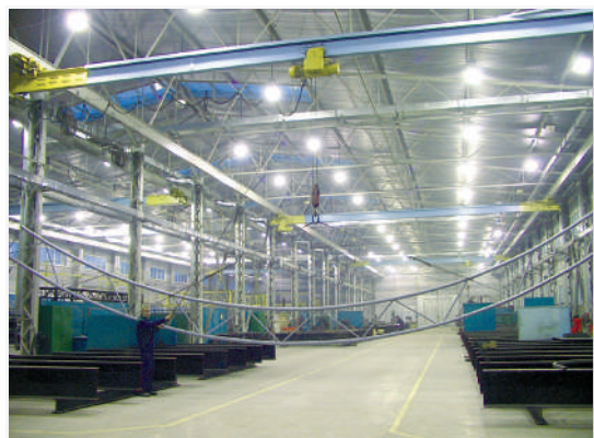
Ділянка виробництва ангарних конструкцій на заводі «Союз-Спецтехніка»