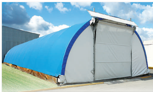
Основа не потребує додаткової підготовки