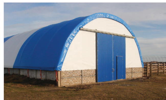
На готовій основі у клієнта