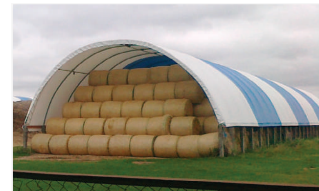
На готовій основі у клієнта