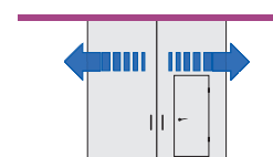
Розкотні з хврткою