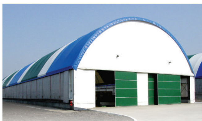
Основа – на закладних елементах