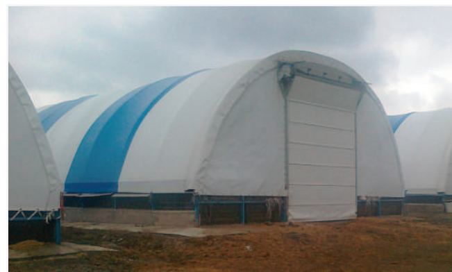
На готовій основі у клієнта